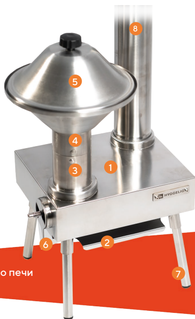
Базовое устройство печи